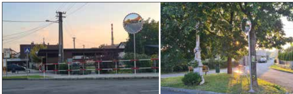
Dvě nová zrcadla byla v prvním zářijovém týdnu instalována na nepřehledných křižovatkách Selská x Školní a na Zadní ulici u křížku.

Projednání územního plánu a jeho případné schválení proběhne s největší pravděpodobností na prosincovém zasedání zastupitelstva obce. ■