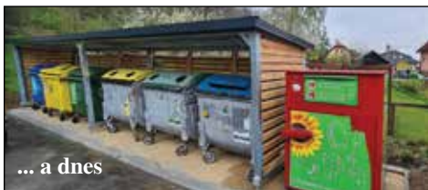
... a dnes