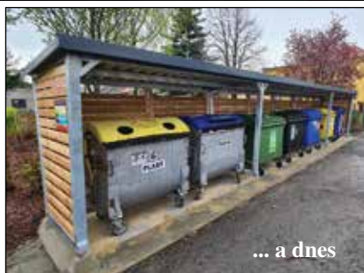
... a dnes