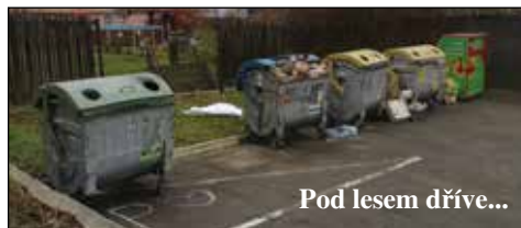
Pod lesem dřívě...