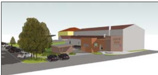
Vizualizace nového obecního úřadu, přilehlého technického dvora a parkování. Autor: Ing. arch. Petr Mlýnek

Do konce roku má být hotov projekt modernizovaného a půdorysně rozšířeného obecního úřadu, který zpracovává vítěz VŘ Ing. arch. Petr Mlýnek z Ateliéru Zóna. První vizualizované návrhy již měli možnost připomínkovat radní obce. Nepotěšila nás však zpráva z krajského úřadu, že kraj nám na projekt nedá dotaci. ■