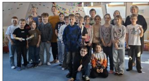
■ Odpoledne se spisovatelkou.