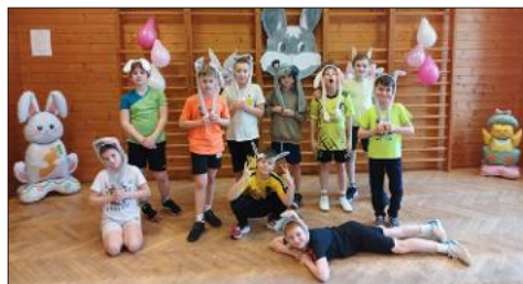
■ Velikonoční sporták.