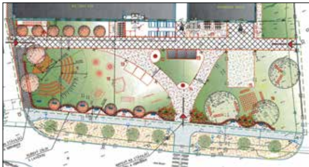
Návrh řešení veřejného prostoru mezi multifunkčním domem a novým chodníkem v centru obce.

Na přiloženém výkresu řešení veřejného prostoru mezi multifunkčním domem a novým chodníkem v centru obce je patrné, že klidovou zónu budou nadále utvářet tři stávající lípy s lavičkami a záhony, na ni navazující volnočasová zóna bude zahrnovat dlážděný chodník umožňující příjezd svatebčanů až ke vchodu do multifunkčního domu, terasu místní hospody, prostor pro postavení prodejních stánků a také kotvení pro vánoční strom nebo májku. Cyklisté budou moci zaparkovat kola ve stojanech nebo nabít své elektrokolo ve stanici umístěné u objektu mateřské školy. Dále zde budou rozmístěny herní prvky pro děti a mini amfiteátr s odstupňovaným přírodním hledištěm. Vše bude zarámo-